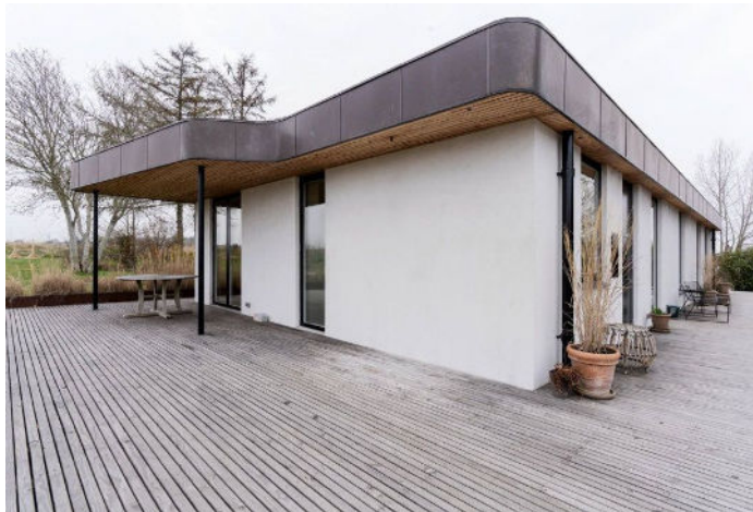
Caspar Hall har udviklet en stern, som skjuler tagrenden og gør det muligt at lave en sikker og tæt afslutning fra de tækkede facader til tagkonstruktionen. Sternen er beklædt med materialet Tombak, der består af 80 pct. kobber og 20 pct. zink.