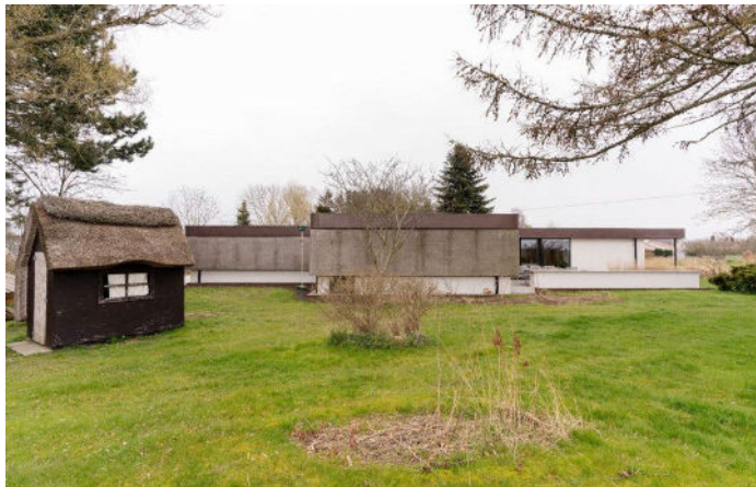
Der er udgang til haven fra stort set alle rum i det 179 kvadratmeter store hus. I den ene ende af haven står et legehus – naturligvis stråttækt.