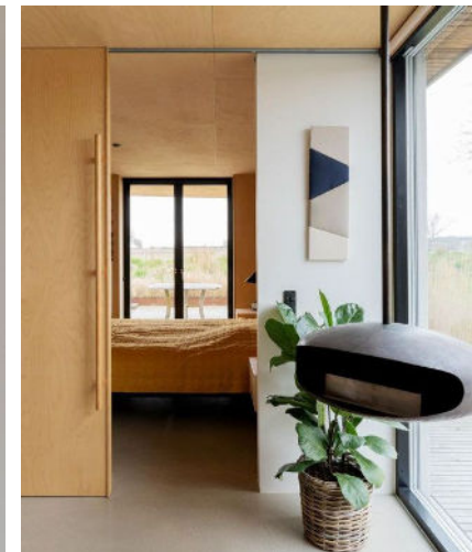
Bag en stor skydedør i birkefiner ligger parrets soveværelse, hvorfra der er direkte adgang til et af badeværelserne samt til terrassen.

► Køkkenet, køgeøen og de åbne bogreoler er tegnet af Niels Park Nygaard, og på de oprindelige tegninger var også en reol bag køkkenbordet. Den endte parret med at fravælge, men nu kan de mærke, at de mangler opbevaringspladsen, så reolen er på listen over kommende projekter.