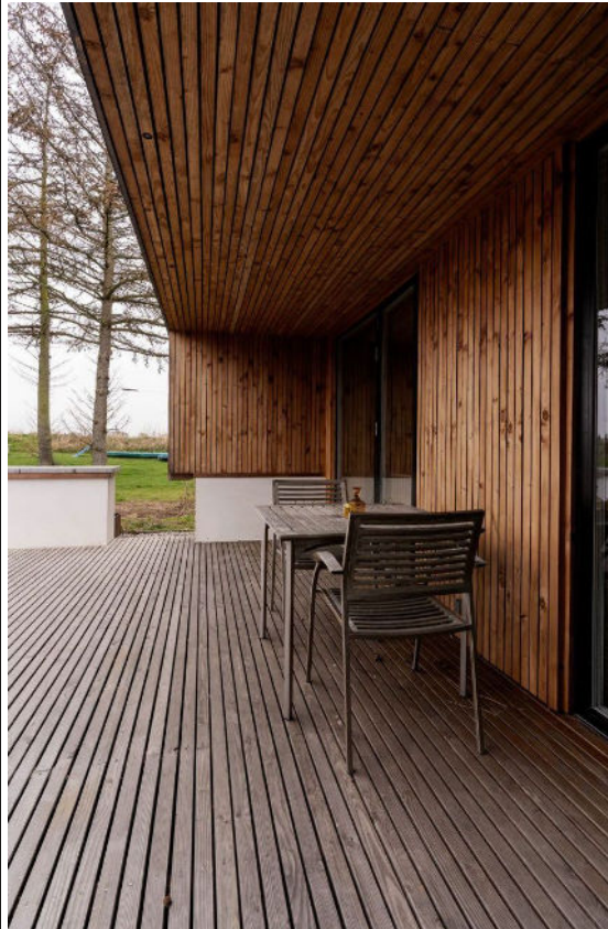
Den store terrasse i douglasgran byder på flere hyggelige siddekroge med udsigt til markerne. Gennem de høje træer kan man også skimte Vallo Slot, der er en stor attraktion for lokalområdet.