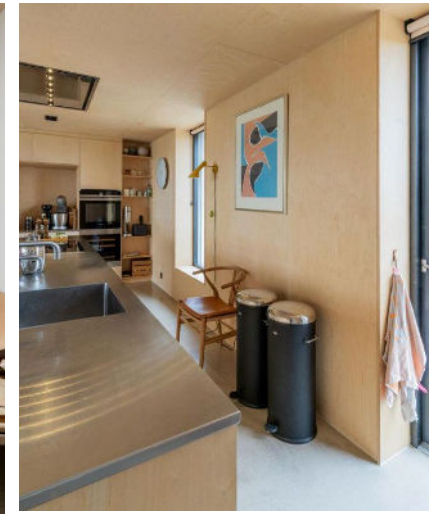
På væggen bag køgeøen skal der bygges reoler ligesom på den tilstødende væg. Vægglampen er af Arne Jacobsen, litografiet er arvet, og spandene er fra Vipp.