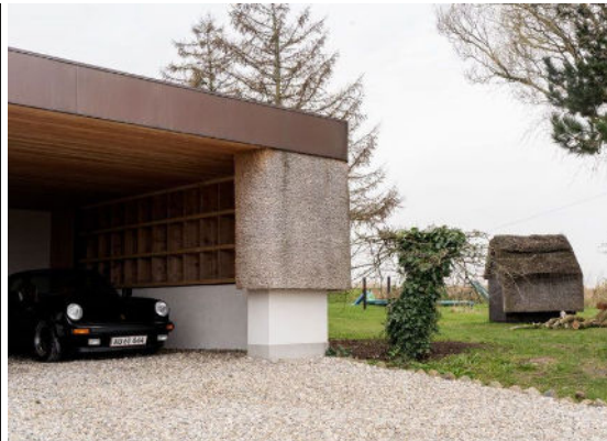
Et af Caspar Halls igangværende projekter er den store garage, der naturligvis også er stråttækt, og som skal rumme ekstra opbevaring.